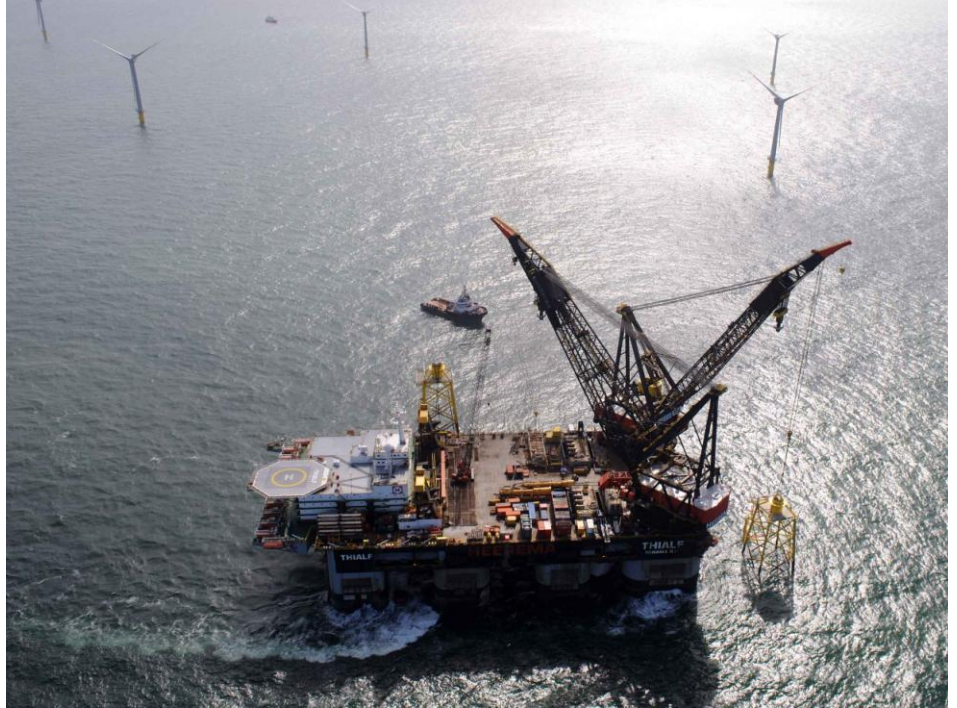
Foto: Tysklands første offshore vindkraftprosjekt, Alpha Ventus. Nøkkelleveranse av 6 understell ble levert av NorWind AS. Sept 2009

-På sikt ønsker vi å levere komplette vindparker for alle havdyp i det globale marked, sier Ivan Østvik, leder for forretningsutvikling i NorWind og prosjekteier for ARENA Norwegian Offshore Wind (NOW).